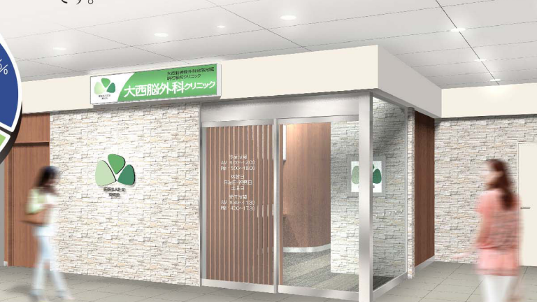
イメージフォト：大西脳神経外科病院にて撮影